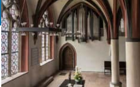
Orgel im Kapitelsaal