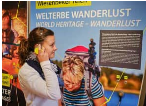
Welterbezentrum Walkenried

Das Welterbe-Infozentrum in Walkenried bietet einen Überblick über das UNESCO-Welterbe im Harz und dessen 3.000-jährige Kulturgeschichte. Zugleich ist mit dem barrierearmen Infozentrum erstmals ein Ort entstanden, der den außergewöhnlichen universellen Wert der Welterbestätte „Bergwerk Rammelsberg, Altstadt von Goslar und Oberharzener Wasserversorgung“ vermittelt. Mehr noch: Die Ausstellung verdeutlicht auch die Bedeutung von UNESCO-Welterbestätten für die gesamte Weltgemeinschaft. Denn das Welterbe gehört allen Menschen und verbindet sie grenzüberschreitend miteinander.