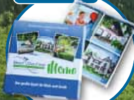
Spaßiges Harz- Memory