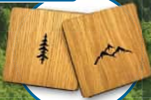
Holzbrettchen mit Harzmotiven